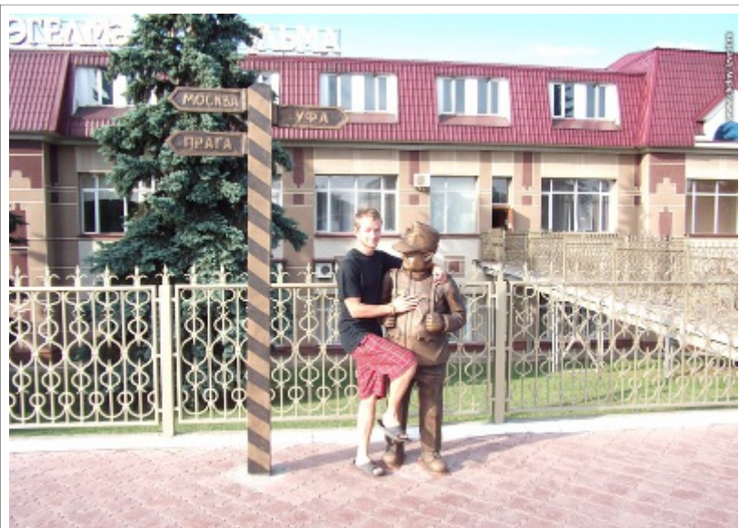
Вокзал в Бугульме - указатель не даст сбиться с пути на Прагу