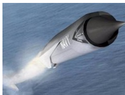
Урок морского боя: американцы потопят русских новыми ракетами