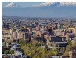
С Россией не вышло, Украина решила воевать с Казахстаном - СМИ