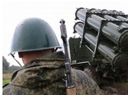
На «Западе-2017» показали уникальное оружие РФ

Депутаты Законодательного собрания области приняли к сведению все проблемные вопросы, которые вынуждены решать оренбуржцы, лишившиеся денег и надежды на скорое новоселье. Участники парламентских слушаний сформировали ряд рекомендаций в адрес регионального правительства и парламента. Соответствующие предложения будут направлены в Правительства РФ и Федеральное Собрание. В том числе – закрепить за заемщиком право на приостановку выплат по ипотеке с момента его включения в реестр обманутых дольщиков, рассмотреть возможность предоставления земельных участков в аренду без проведения торгов и установления льготных ставок за пользование земельными участками.