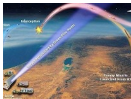
Американские ракеты отстали от российских